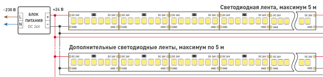
Схема 2. Подключение нескольких светодиодных лент с двух сторон.

Рекомендуется использовать для обеспечения равномерного свечения ленты по всей длине.